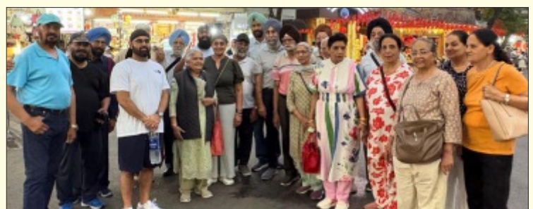
Members of MSCA on Vietnam Visit