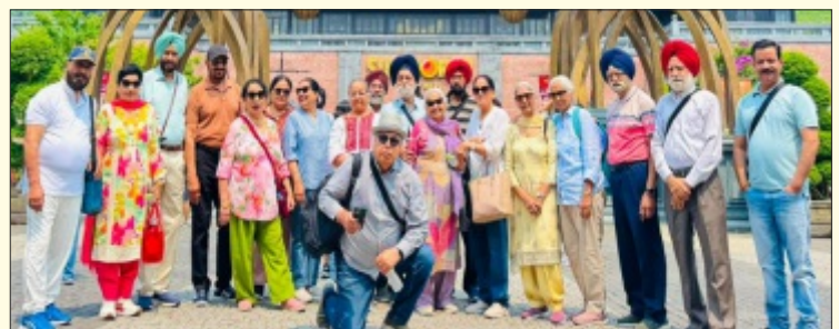
Members of MSCA at their Palace in Seoul South Korea.