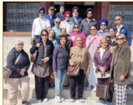
Members of MSCA at SAR-Macau