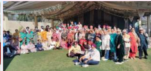
Enjoying Picnic in Cozy Weather

LAF Centre for Senior Citizens : City Park, Opp. H. No. 1151, Sector 68, Mohali Phone : 0172-3599512