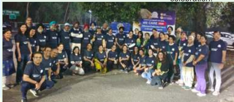
Walkathon on International Women's Day at Leisure Valley Park, Phase-8, Mohali