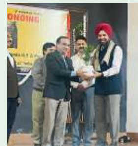
Honoured by the PU Registrar, during Helpage India celebration.