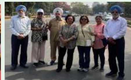
MSCA members Visited, Amrit Udyan, Rashterpati Bhawan news Delhi.