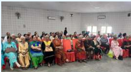
International Women's Day Celebration