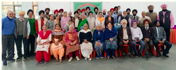
Group Photo of Sports Winners